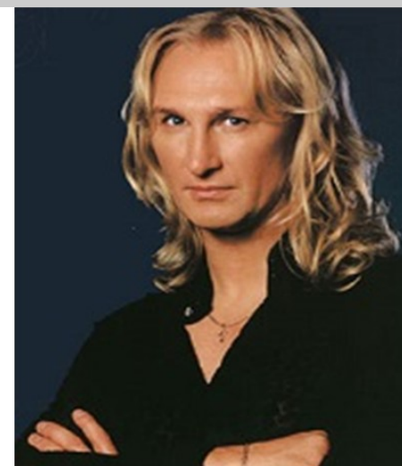
Алек- Иванов сандр

Певец, музыкант, лидер группы «Рондо». В детстве занимался самбо, призер чемпионатов Москвы. Мастер спорта, обладатель черного пояса по дзюдо, чемпион Москвы.