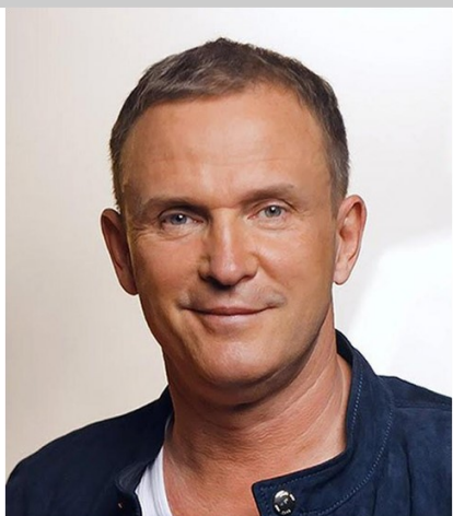
Виктор Ры- бин

Певец, музыкант, солист группы «Дюна». Кандидат в мастера спорта по самбо.